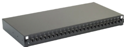
B. Panneaux partiellement ou entièrement équipés