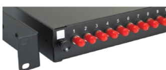
C. Bras de fixation réglables. Étiquetage clair des ports et du panneau.