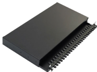
A. Tiroir coulissant

Les panneaux de connexion ST Excel sont des boîtiers de type « plateau », à tiroir coulissant, adaptés au raccordement direct ou par épissure de 24 fibres maximum par unité d'espace rack. Chaque panneau est fabriqué en acier haute qualité, d'une épaisseur de 2 mm, et recouvert d'une peinture en poudre noire, garantissant solidité et durabilité. Le nombre spécifié d'adaptateurs simplex est installé à l'avant du panneau de connexion, de gauche à droite. La face avant contient également les dispositifs de déblocage du tiroir coulissant. Chaque adaptateur est doté d'un cache-poussière identifiable par sa couleur : noir pour multimode, rouge pour monomode. Chaque adaptateur simplex peut recevoir une fibre raccordée et chaque panneau comprend un jeu de bras de fixation réglables, ainsi qu'un kit de rangement des câbles (presse-étoupes, serre-câbles et pont de raccordement par épissure 24 voies).